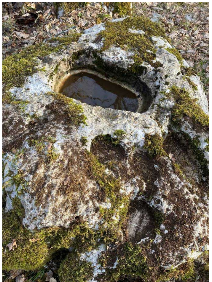
Ici, cupules aux Teyssonières (Concots)

Cette conque pourrait apparaître comme un bénitier naturel, le patron du village étant St Jean Baptiste (ety. plonger dans l'eau) qui avec son bâton de berger, perce la roche de son feu pour faire jaillir la source. 3