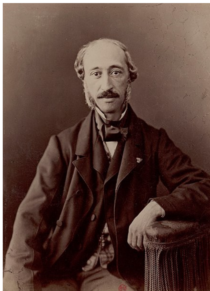
Edmond Becquerel , physicien français, 1820-1891

Cocorico ! On peut donc confirmer que le procédé photovoltaïque a été inventé par le Français Edmond Becquerel, et exploité par l'Américain Robert Millikan.